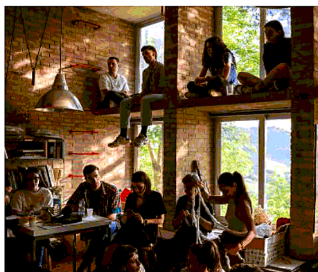
Studenti dell'Accademia durante la full immersion di Urbino