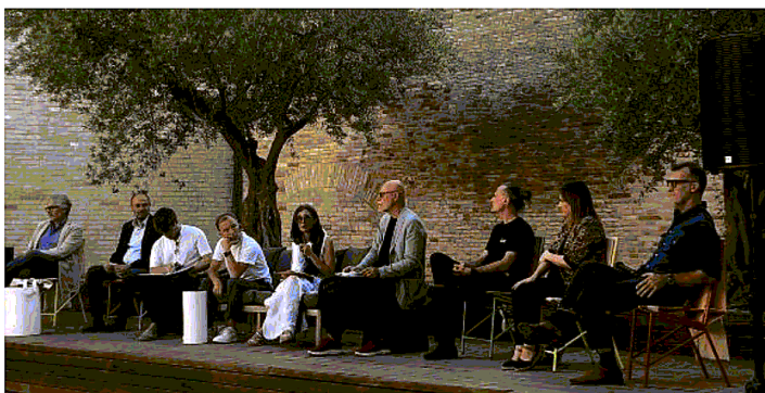
Convegno all'orto dei pensatori il progetto The wow house organizzato dall'Accademia di belle arti

Per «Wow house» si è inteso infatti questo: innovazione progettuale sociale sull'abitare. Il progetto ha permesso agli studenti di essere ospitati da Chambers, in occasione del Salone del mo-