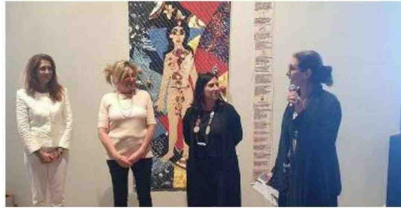
La presentazione della mostra ieri alla Mole Vanvitelliana alla presenza degli assessori alla Cultura dei Comuni di Ancona e Macerata