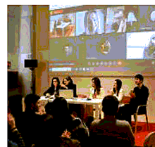
Meeting virtuale del progetto